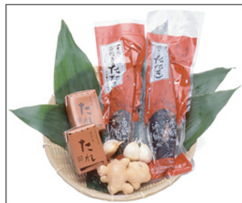
一本釣り 藁焼き鰹たたき / 梅原 真